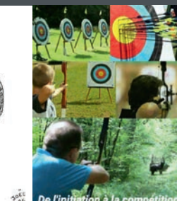
De l'initiation à la compétition