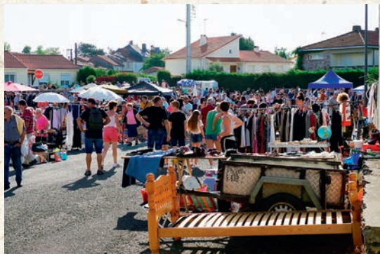
Dimanche 15 septembre : Vide grenier