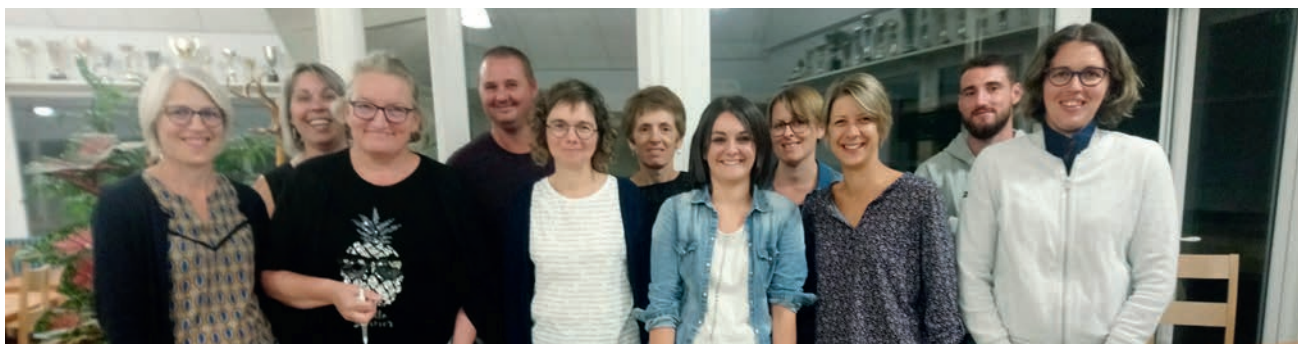
Les membres du bureau et les entraîneurs ont présenté leur projet pour la saison 2019-2020