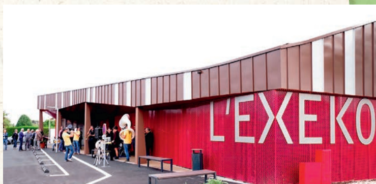
Vendredi 27 septembre : Inauguration de l'EXEKO