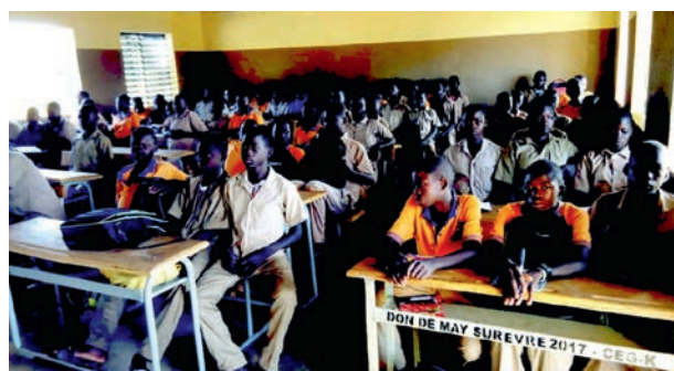
Des collégiens plus âgés que chez nous à cause des conditions de scolarité difficiles

meilleurs élèves sont en voie d'acheminement et devraient être arrivés à la rentrée. (Deux vélos par classe).