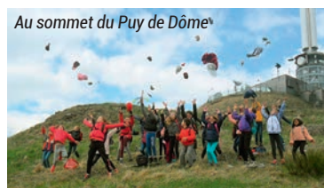
Au sommet du Puy de Dôme