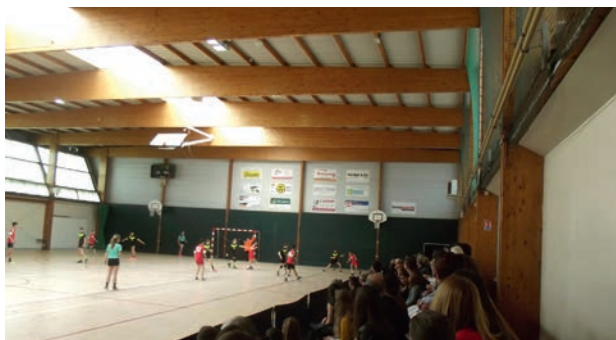
Organisation des demi-finales Coupe et Challenge de l'Anjou en avril 2019

L'Énergie Handball le May entame sa cinquième année et ouvre une école de Hand afin d'initier les enfants à ce sport toujours un peu méconnu dans notre région malgré les très bons résultats de nos équipes nationales plusieurs fois Championnes d'Europe et du Monde (hommes et femmes). L'école de hand est mixte et est ouverte aux filles et garçons nés(es) en 2013 et 2012.