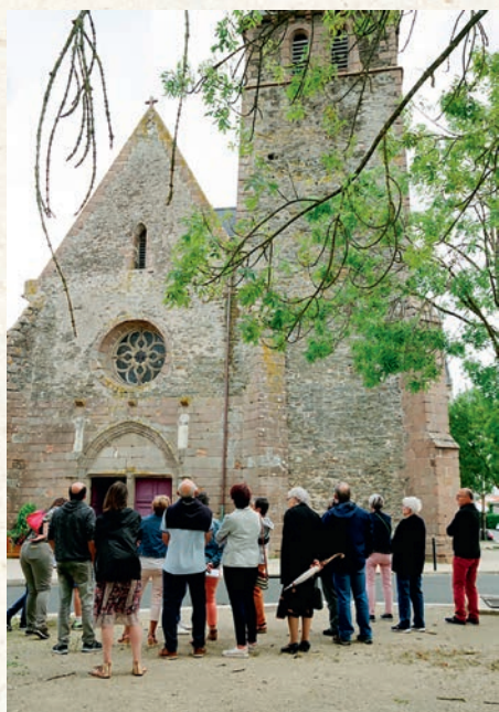
Samedi 21 et Dimanche 22 septembre : Journée du Patrimoine