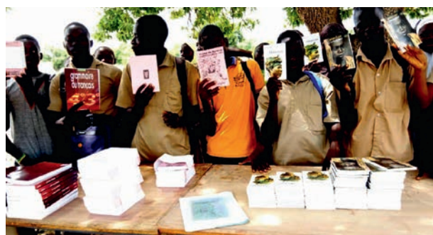
Avec les livres achetés grâce à notre soutien

Message du directeur reçu il y a quelques jours :