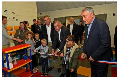
Inauguration du Centre Jean Ferrat