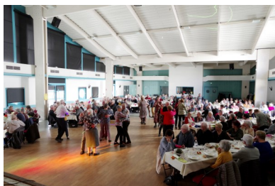
Repas des aînés