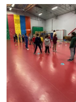
Accueil de loisirs « Les petits artistes »

Parution numéro 7 : le Vendredi 14 avril