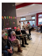
Bal des résidents