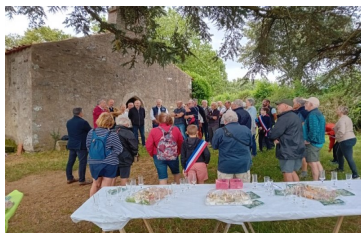
Inauguration du sentier fil de l'Èvre