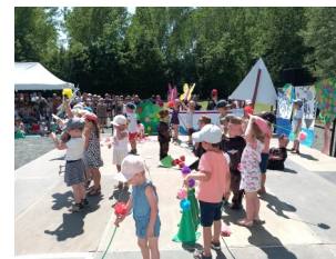
Kermesse de l'école Notre-Dame

Parution numéro 10 : le vendredi 8 septembre