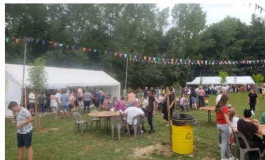
Fête de l'école Jean Moulin