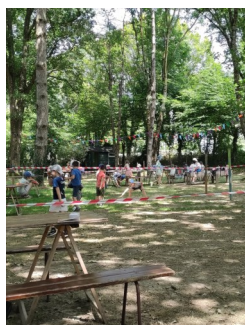
Ouverture du centre de loisirs les « petits artistes » à la prairie de l'étang