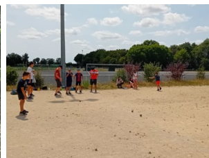
Après-midi jeux de plage avec les anim'ados et animations sportives