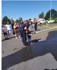
Portes ouvertes des pompiers