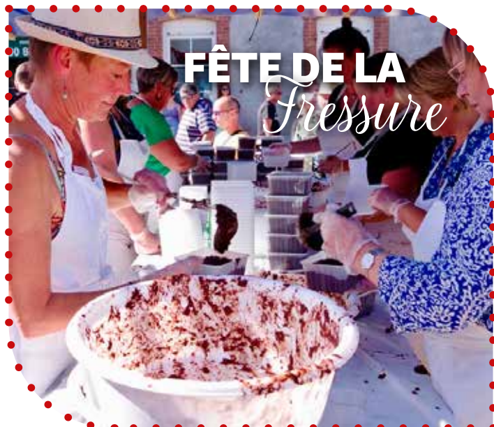
FÊTE DE LA Fressure