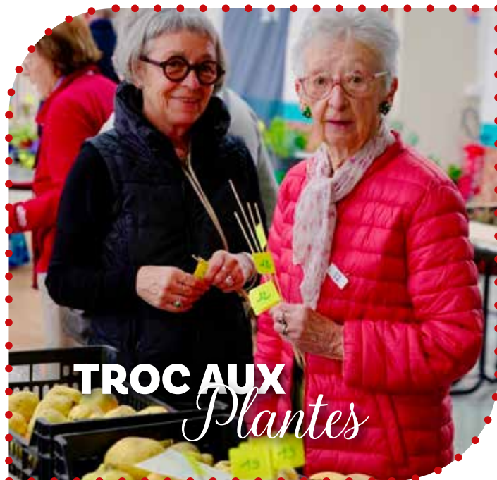
TROC AUX Plantes