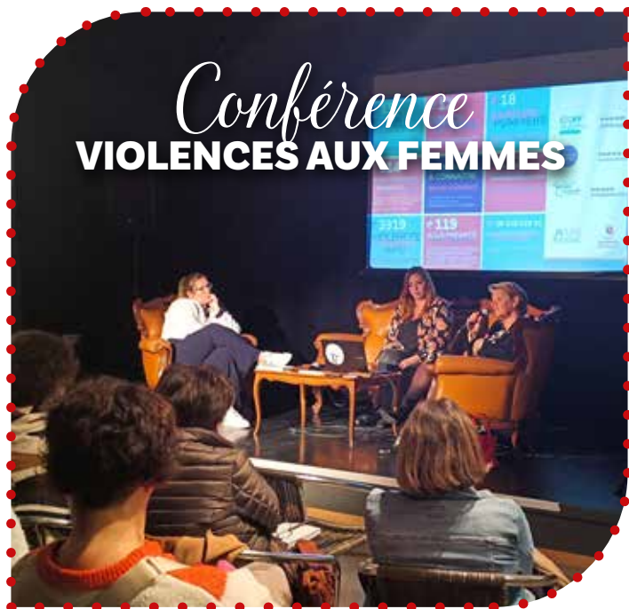
Conférence VIOLENCES AUX FEMMES