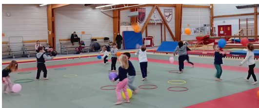
Fin d'année sportive pour l'EMS et l'éveil