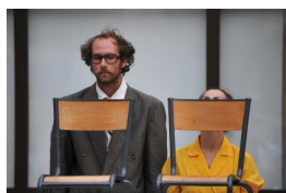
Spectacle de Noël Senghor